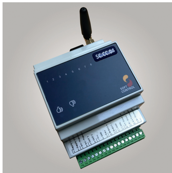
Ill. 1 - Billede af SC.CC.04.