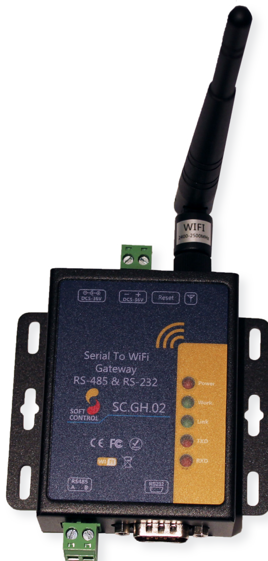
Ill. 1 - Billede af SC.GH.02.