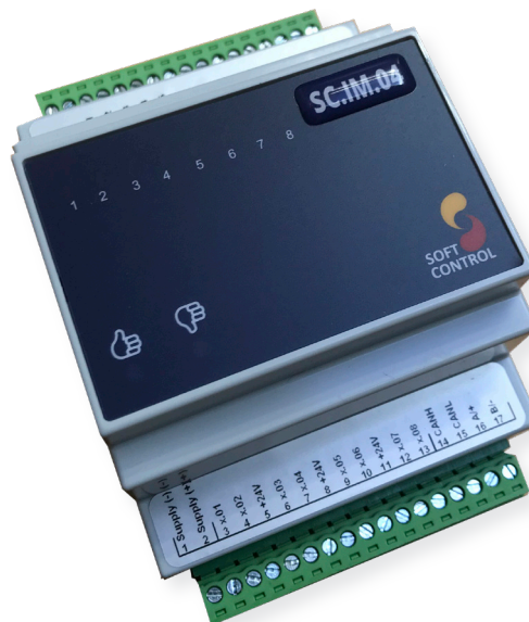
Ill. 1 - Billede af SC.IM.04.

De 8 digitale indgange kan fungere som pulstællere. Kan detektere pulser ned til 20 ms.